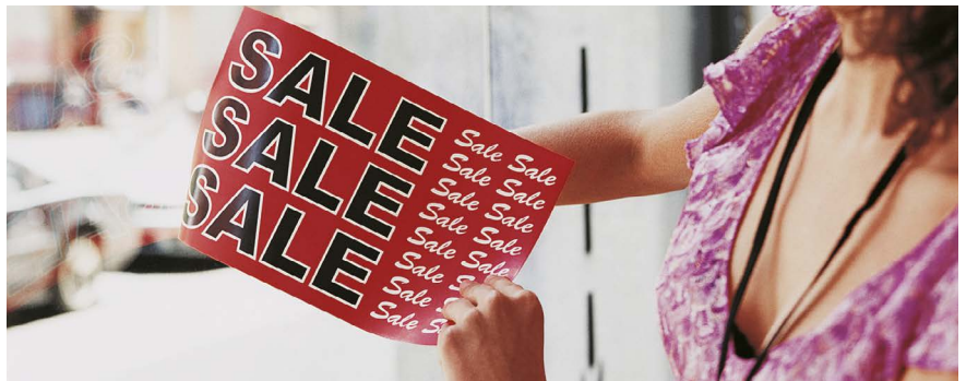
Carteles para ventanas Xerox® NeverTear

Nuestro tóner EA de baja fusión fusiona la salida en poliéster usando un método de enlace químico propio, que asegura una calidad de imagen superior en sustratos especiales, como el poliéster y otros. Nuestro tóner, admite Premium NeverTear, resistente al agua, al aceite, a la grasa y a la rotura.