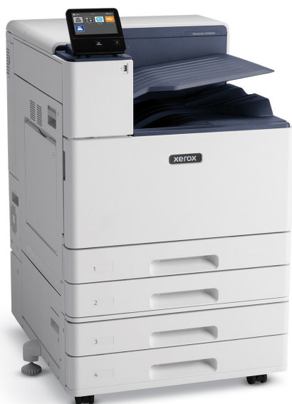
VersaLink® C8000W con módulo de dos bandejas