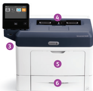
Impresora Xerox® VersaLink® B400 Impresión.

2 Los puertos USB pueden desactivarse; 3 Solo VersaLink B405.