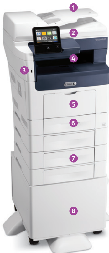
Equipo multifunción Xerox® VersaLink® B405 Impresión. Copia. Escaneado. Fax. Correo electrónico.