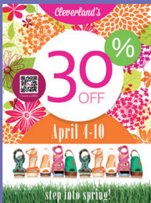
Punto de venta

Producir grandes cantidades de trabajos de gran formato solía implicar diversos inconvenientes: la necesidad de recurrir a varias impresoras y dedicar varios días a satisfacer las demandas de un solo cliente. No es de extrañar pues que en ocasiones estos trabajos se considerasen un problema. Pero con la impresora Xerox Wide Format IJP 2000, son una verdadera oportunidad de negocio.